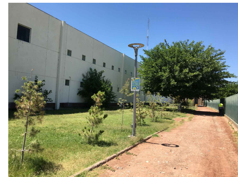
pa.-POSTE DE ALUMBRADO