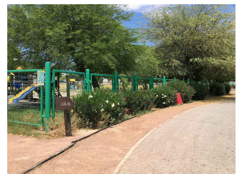
RB,CB2.- RETIRO Y COLADO DE BORDILLO