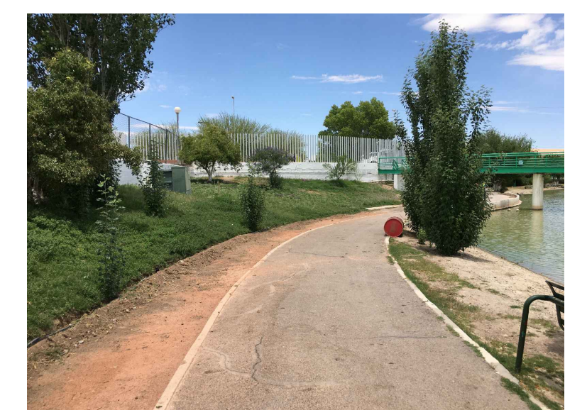
RB,CB1.- RETIRO Y COLADO DE BORDILLO