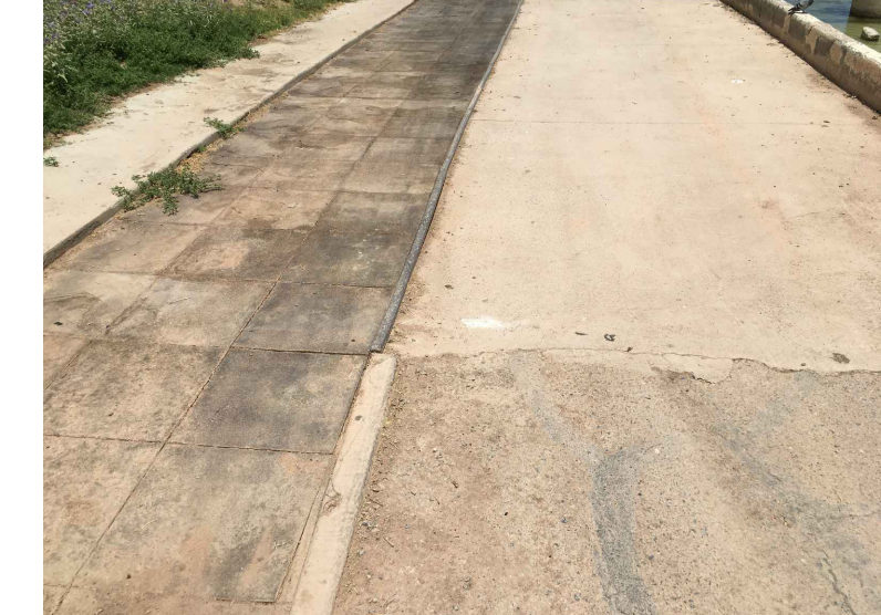
AR1.- NIVELACION Y BOMBEO DE ARCILLA