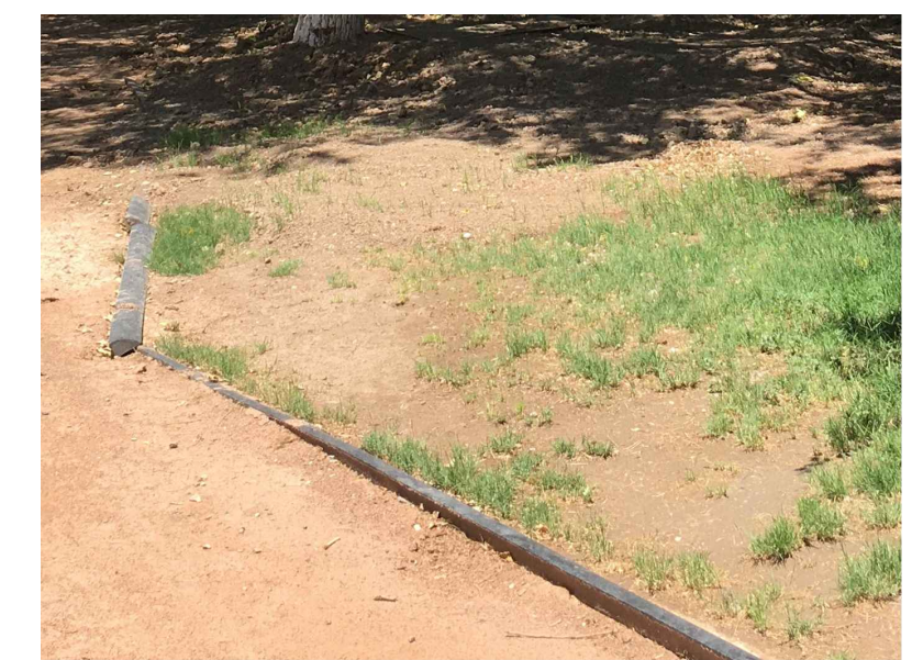
FP.- FRONTERA DE PVC A RETIRAR