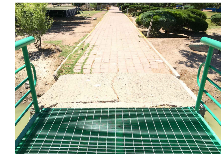
RA.-DEMOLICIÓN DE CONCRETO LAVADO