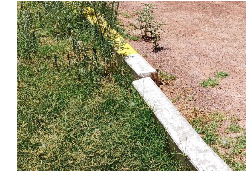
RB.-DEMOLICIÓN DE BORDILLO DE CONCRETO LAVADO