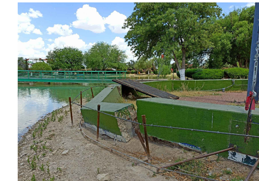
DM1-2.-DEMOLICIÓN DE MURETE ALBAÑILERÍA