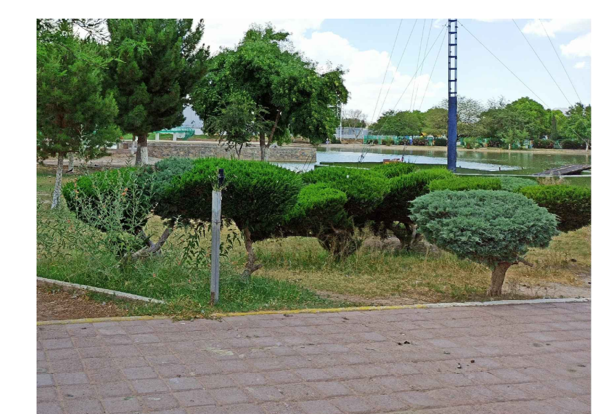
arb.- TRANPLANTE DE ELEMENTO VEGETAL (ARBUSTO)