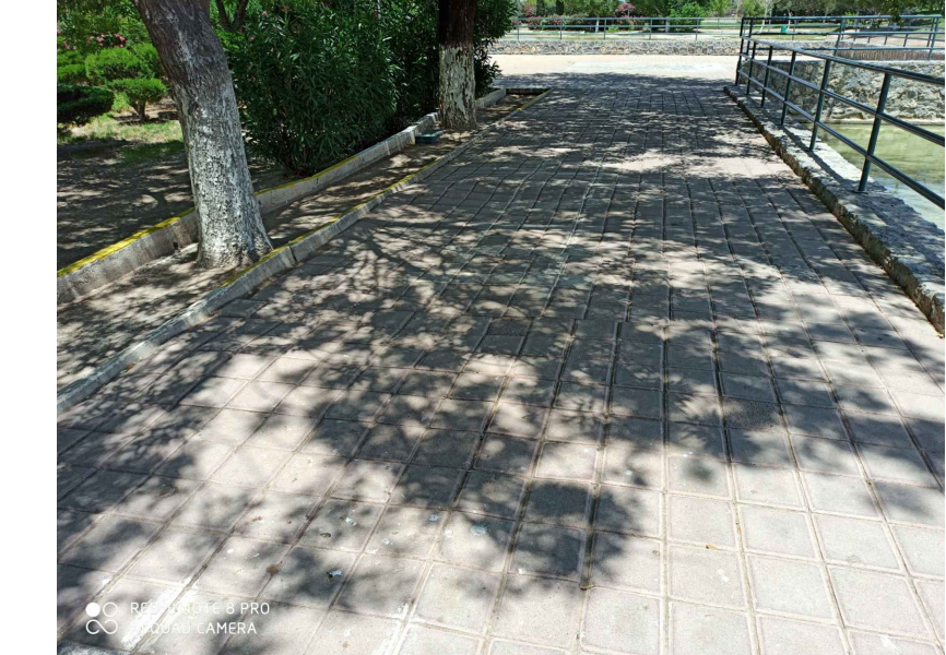
RA2.- RETIRO DE ADOQUIN