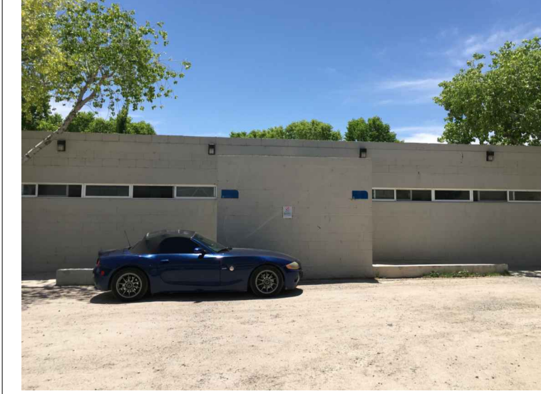
F1.- FACHADA NORTE