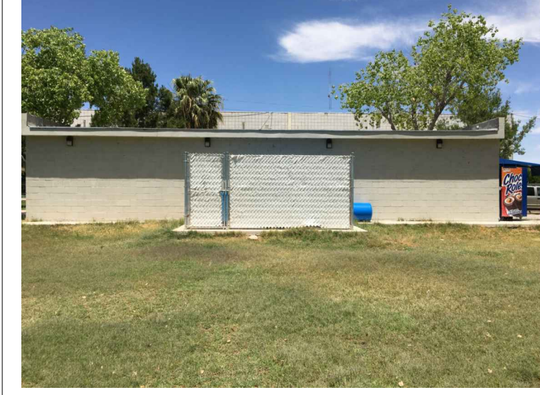
F3.- FACHADA SUR