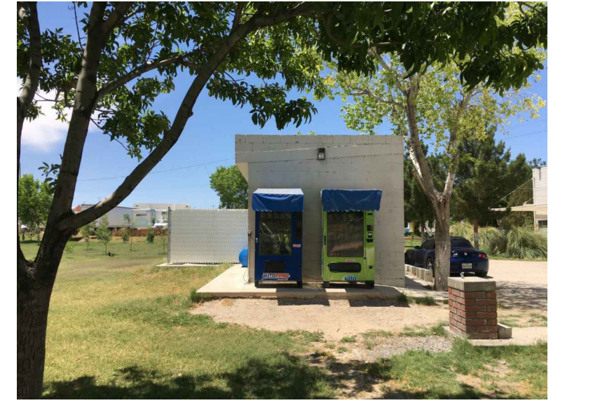
F4.- FACHADA OESTE