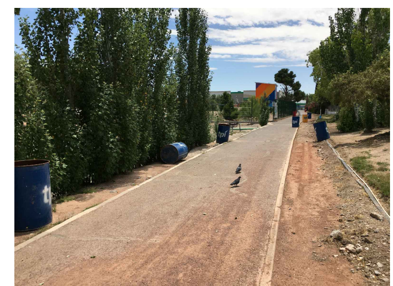
RB,CB4.- RETIRO Y COLADO DE BORDILLO