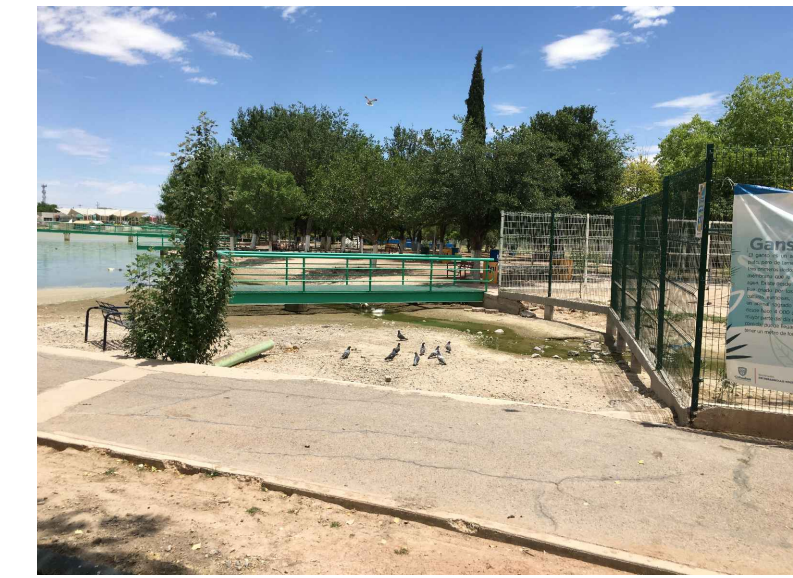
RB,CB2,3.- RETIRO Y COLADO DE BORDILLO