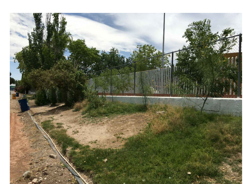
FP.- FRONTERA DE PVC A RETIRAR