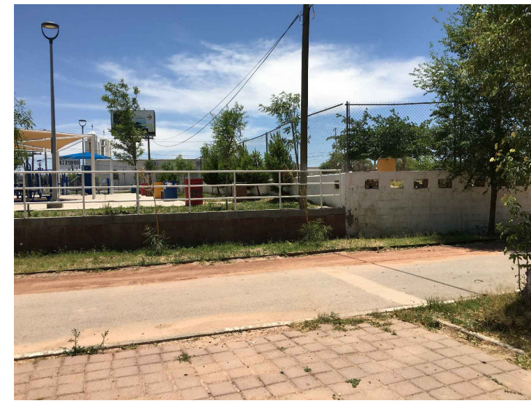
FP.- FRONTERA DE PVC A RETIRAR