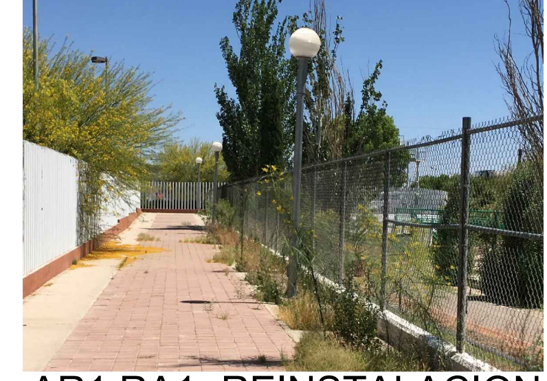
AR1,RA1.-REINSTALACION DE ADOQUIN