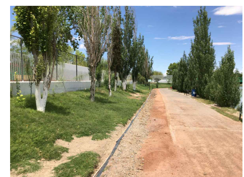
FP.-FRONTERA CORTE MEDIA CAÑA