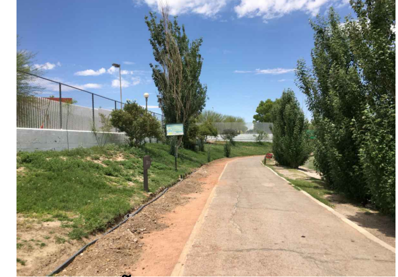
sei.-SEÑALÉTICA DE INFORMACIÓN