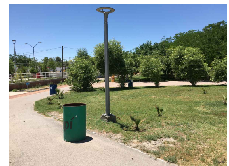
pa.- POSTE DE ALUMBRADO