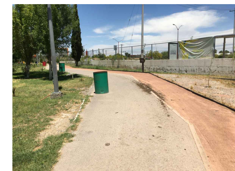
MP4.-PINTURA EN APLANADOS DE MURO