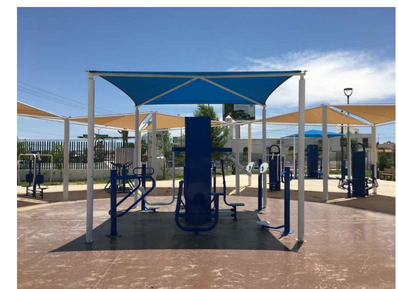
sc,st.-SOMBRA CUADRADA SOMBRA TRIANGULAR