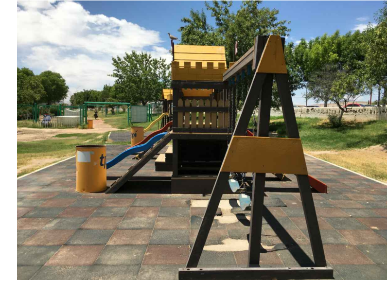
AR.- REPOSICIÓN COLCHONETA