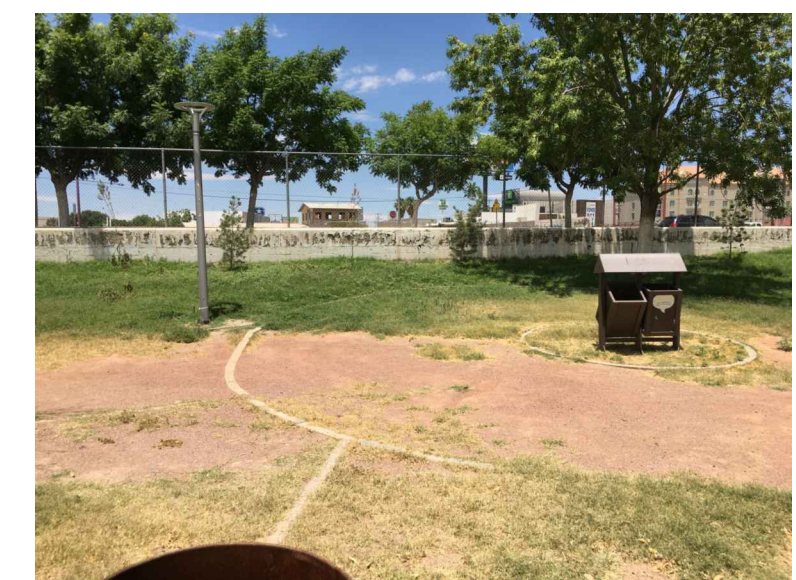
pa, bde.- POSTE DE ALUMBRADO BOTE DOBLE ESPECIAL