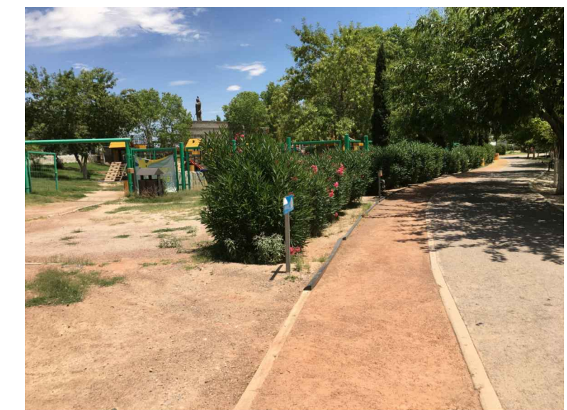
sei.- SEÑALETICA DE INFORMACION