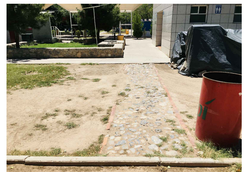
RA5,RB1.- DEMOLICIÓN EMPEDRADO CORTE RETIRO BORDILLO