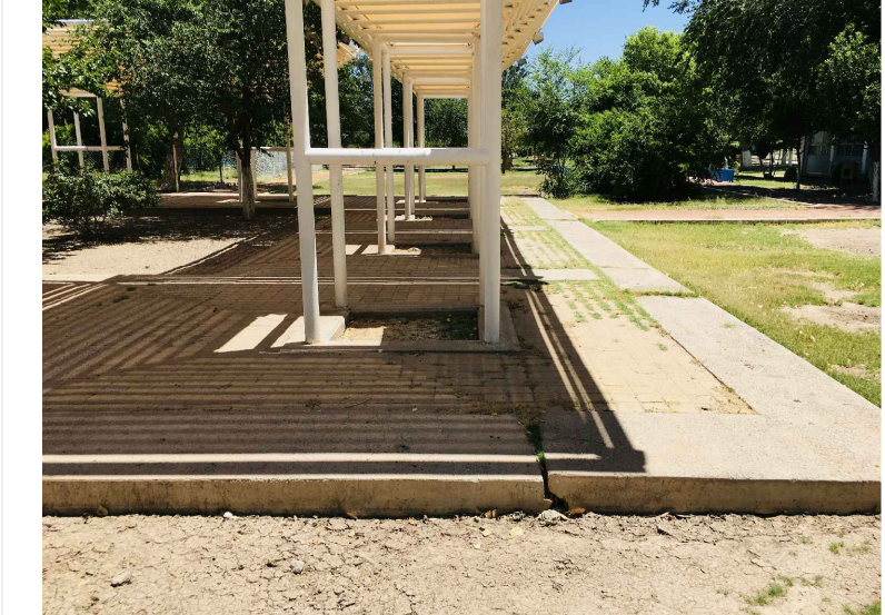
RA6.-DEMOLICION CONCRETO LAVADO