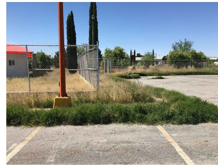
PA. POSTE DE ALUMBRADO