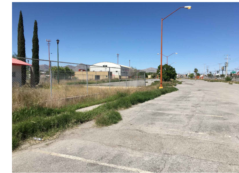
PA. POSTE DE ALUMBRADO