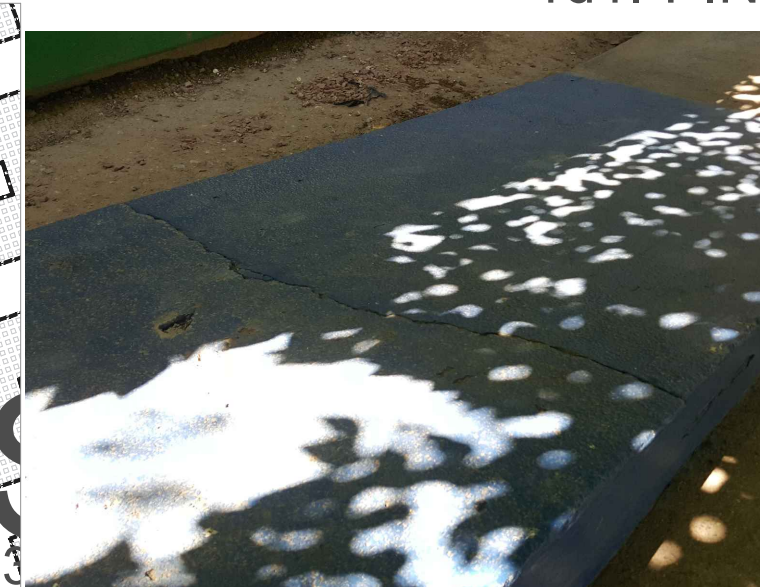
VR2.-APLANADO DE MURETE rd3.-PINTURA EN RAMPA