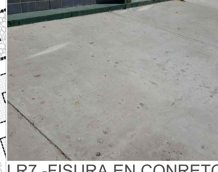
LR7.-FISURA EN CONCRETO