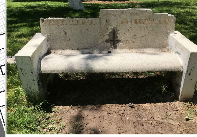
bc.-BANCA DE CONCRETO