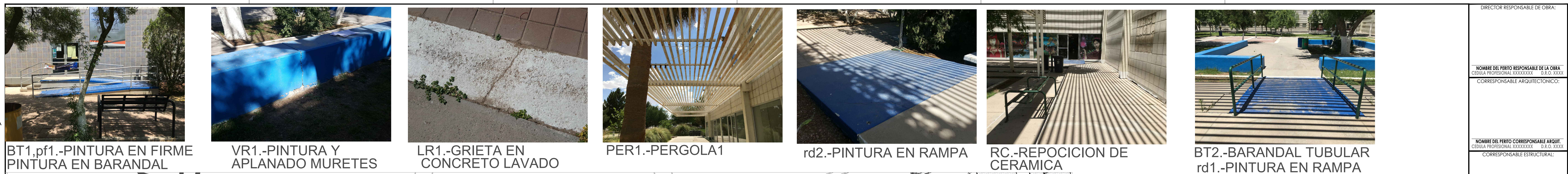
BT1, pf1.-PINTURA EN FIRME PINTURA EN BARANDAL