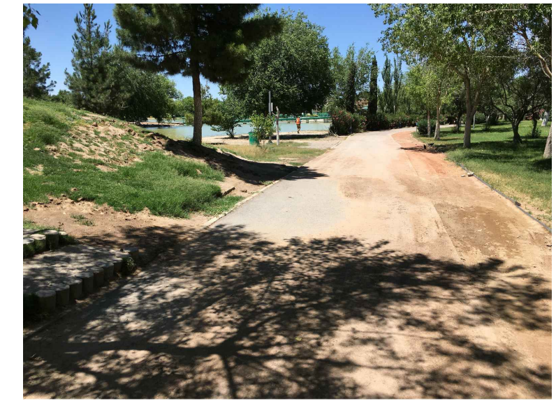
RB, CB4.- RETIRO Y COLADO DE BORDILLO