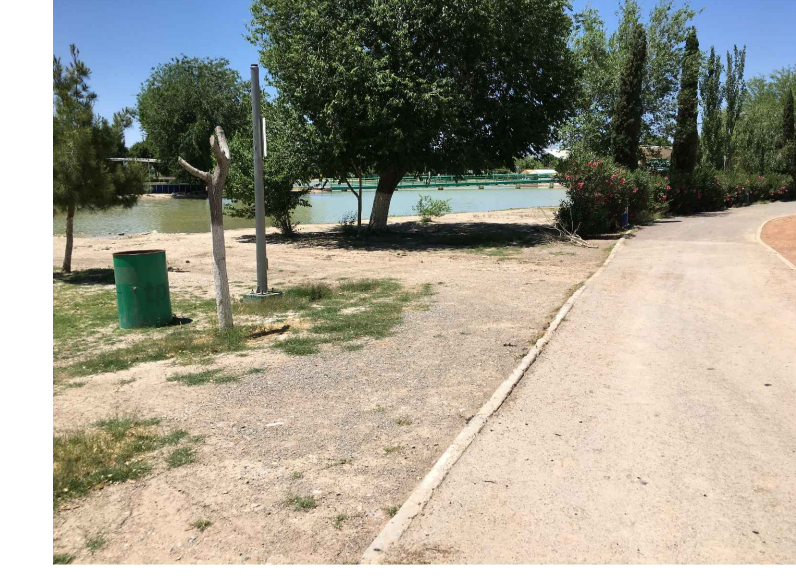
RB,CB3.- RETIRO Y COLADO DE BORDILLO