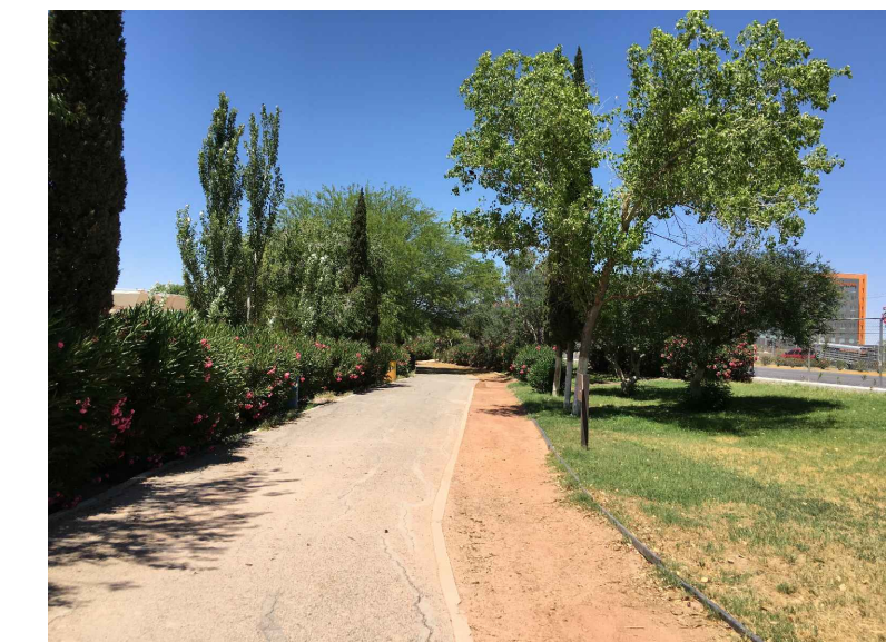
RB,CB,1,2.- RETIRO Y COLADO DE BORDILLO